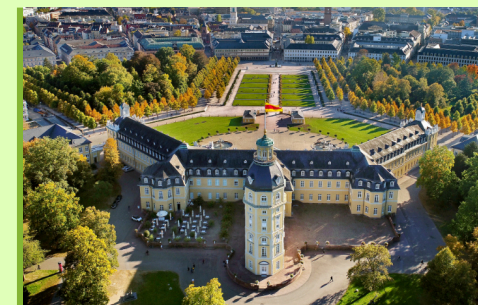
Blick über das Schloss Karlsruhe

Weitere Infos und Erkundungsideen: karlsruhe-erleben.de