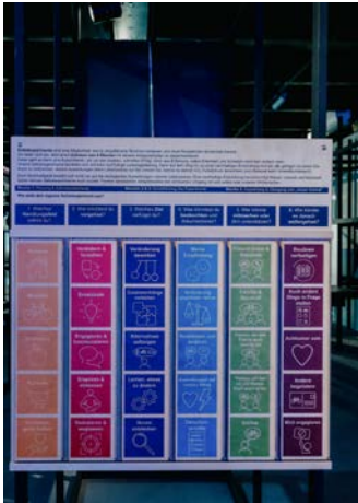
Frühjahr 2022 Exponat für MS Wissenschaft