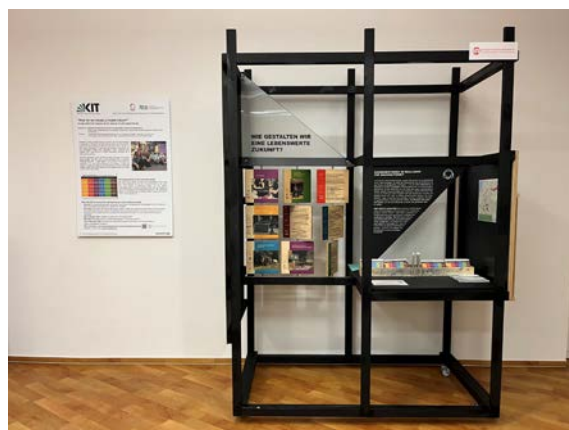
SE-Exponat ↑ (steht derzeit in der KIT-Bib)