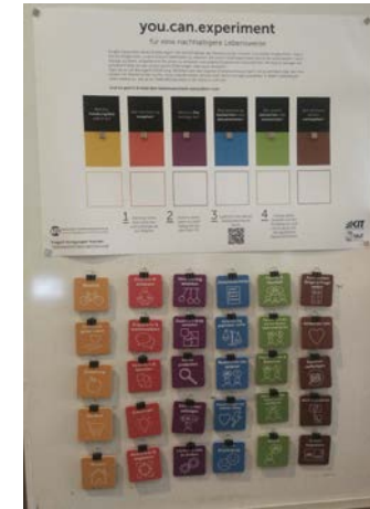
seitdem SE-Generator als festes KAT Produkt