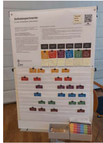
Juni 2022 Mobile Variante für RL-Tagung